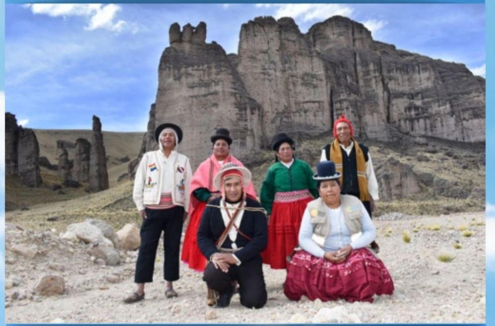
DISTRITO DE ILAVE