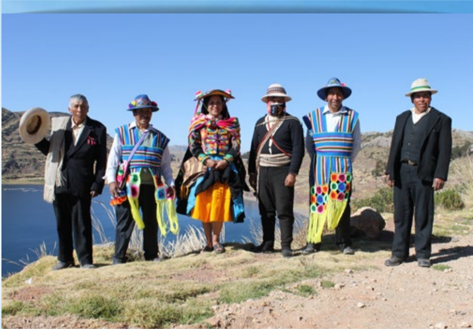
DISTRITO DE PUSI