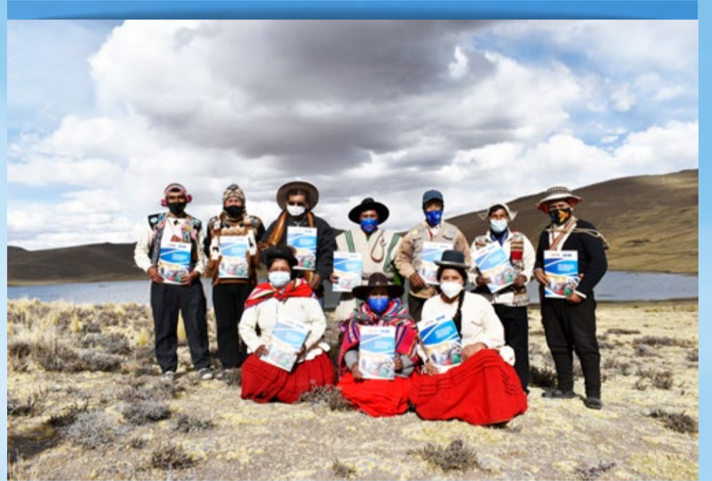
DISTRITO DE MAÑAZO