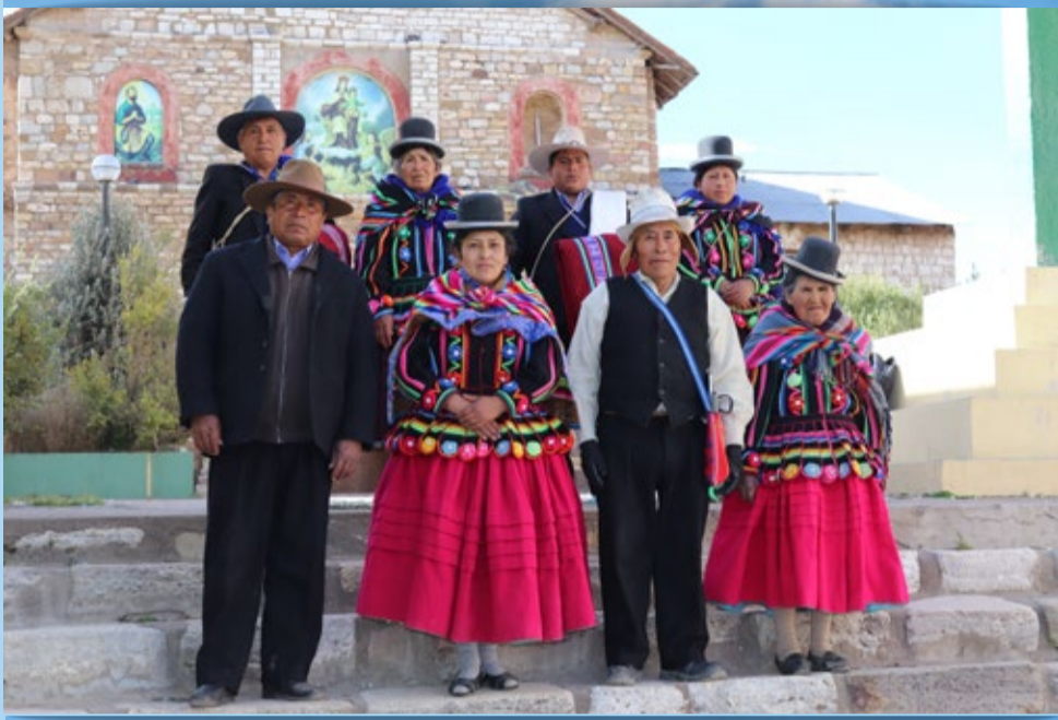
DISTRITO DE TARACO